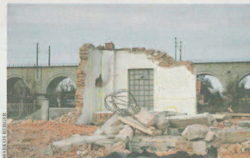
Abriß eines Bauhofs und Chemie-Alarm: Fall für den Sanierungsfonds